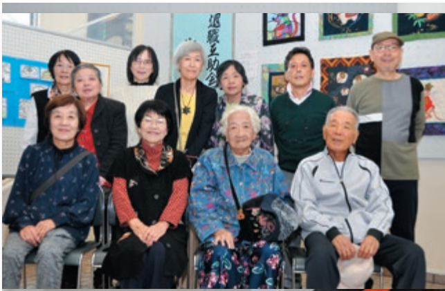
【工芸・編物の部の皆さん】