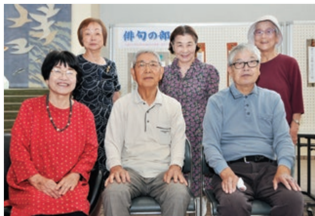
【俳句の部の皆さん】