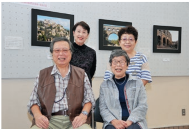
【写真の部の皆さん】