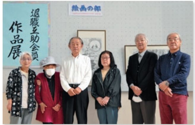
【絵画の部の皆さん】