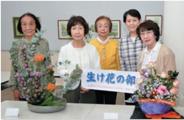
【生け花の部の皆さん】